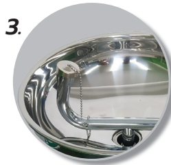
3. มีกรองฝุ่น และฝาปิด ที่วาล์วล้างตาในตัว