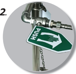
2. โครงสร้างทำมาจาก สแตนเลส 304 สวยงาม ไม่เป็นสนิม